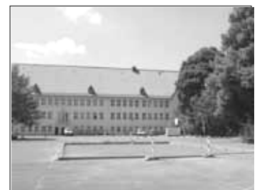
Bald wird hier gebolzt

Angekündigt war das DFB-Minispielplatz schon für dieses Jahr. Aber wie auf vielen Baustellen, sind Zeitpläne schnell mal überholt. Nun wird im nächsten Frühjahr ein neuer Anlauf genommen. Wenn die Witterung es wieder zulässt, wird das DFB-Minispielplatz auf dem Schulhof der Grundschule Ziesberg fertig gestellt, pünktlich zur kommenden Sommersaison. Der städtische Eigenbetrieb Gebäudemanagement, Einkauf und Logistik kümmert sich darum.