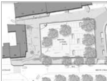
Der Entwurf des ‚neuen‘ Martin-Luther-Platzes

Die Pläne sind gezeichnet, nun muss nur noch gebaut werden. Bis Ende 2008 wird alles Weitere von der Verwaltung vorbereitet. Dann starten die Bauarbeiten. Während auf dem Martin-Luther-Platz die Handwerker das Sagen haben, werden die Marktleute Dienstags und Freitags für eine Weile ihre Frischwaren in der für diesen Zweck gesperrten Weserstraße, gegenüber der Sparkassen-Filiale, anbieten.